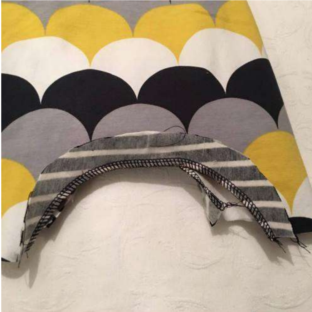
Sy fast infodringen på fram- och bakstycket.