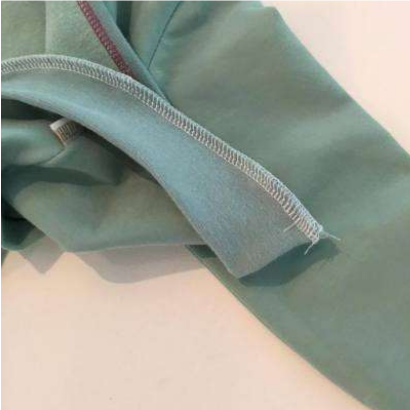
Sy fast mudden