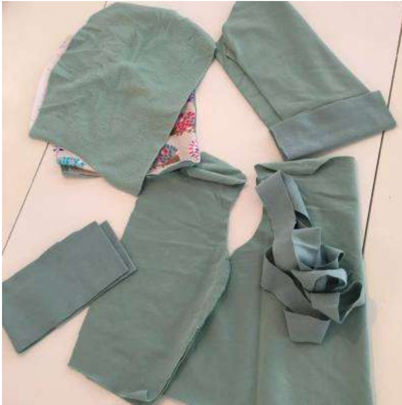
En jacka med huva, kantband och knappar.