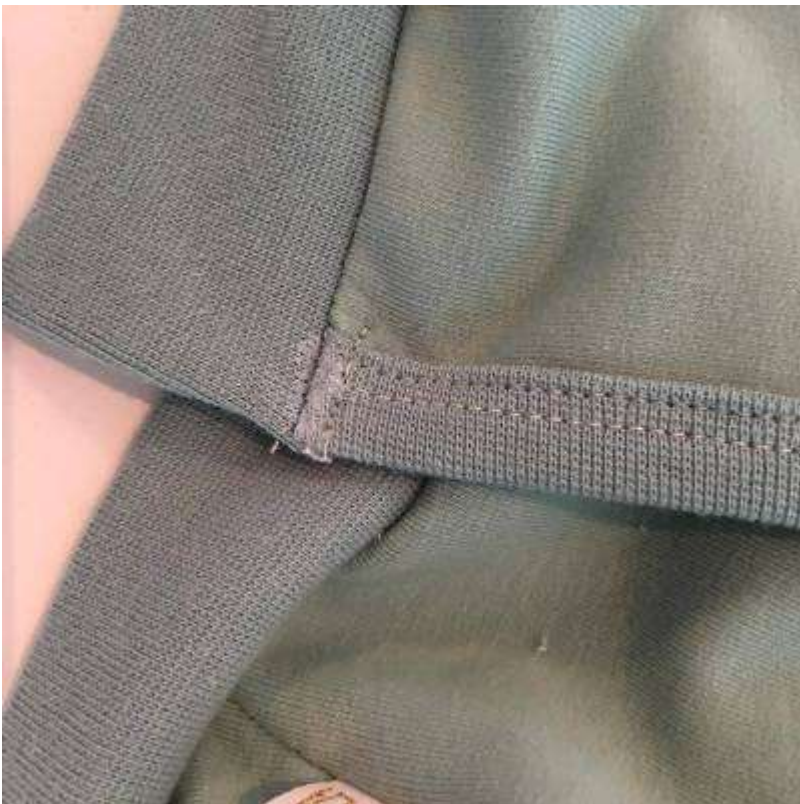
Sy fast sömsånen med en stickning precis vid jacköppningen.