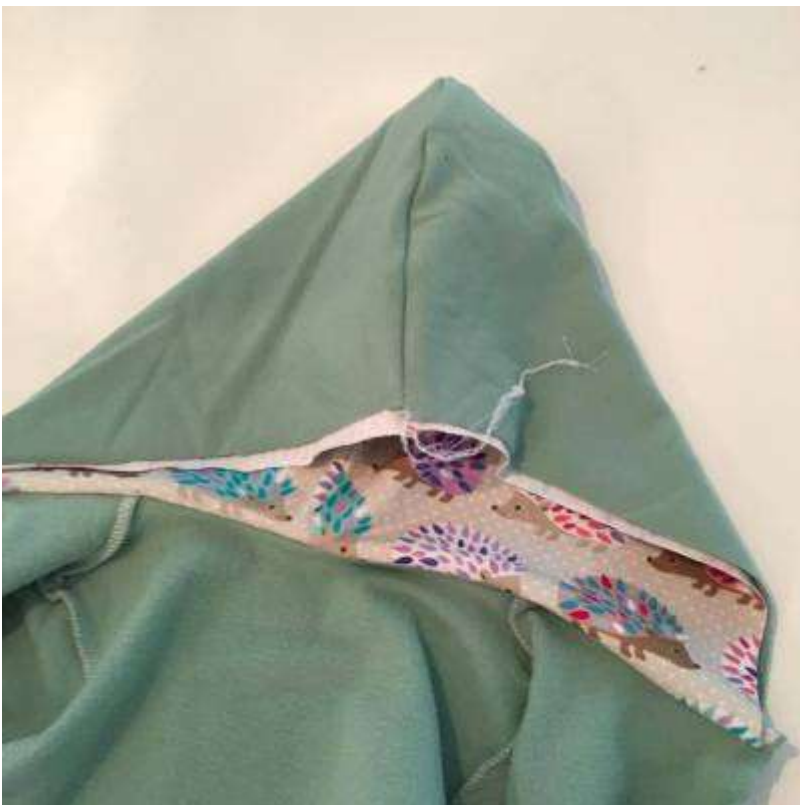
Stoppa in fodret i ytteryget.