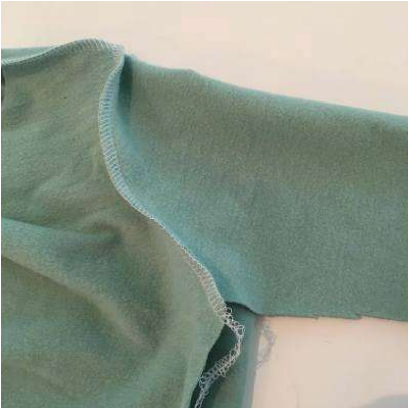
Sy fast ärmen.